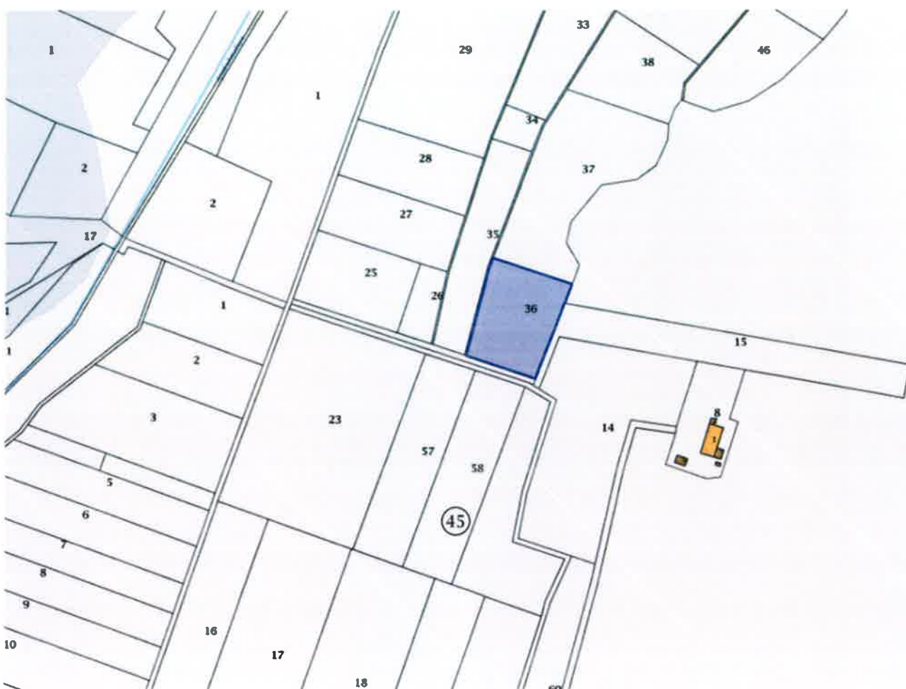
Фиг. 1 Извадка от Кадастралната карта на гр. Вълчи дол, ПИ с идентификатор 12574.45.36