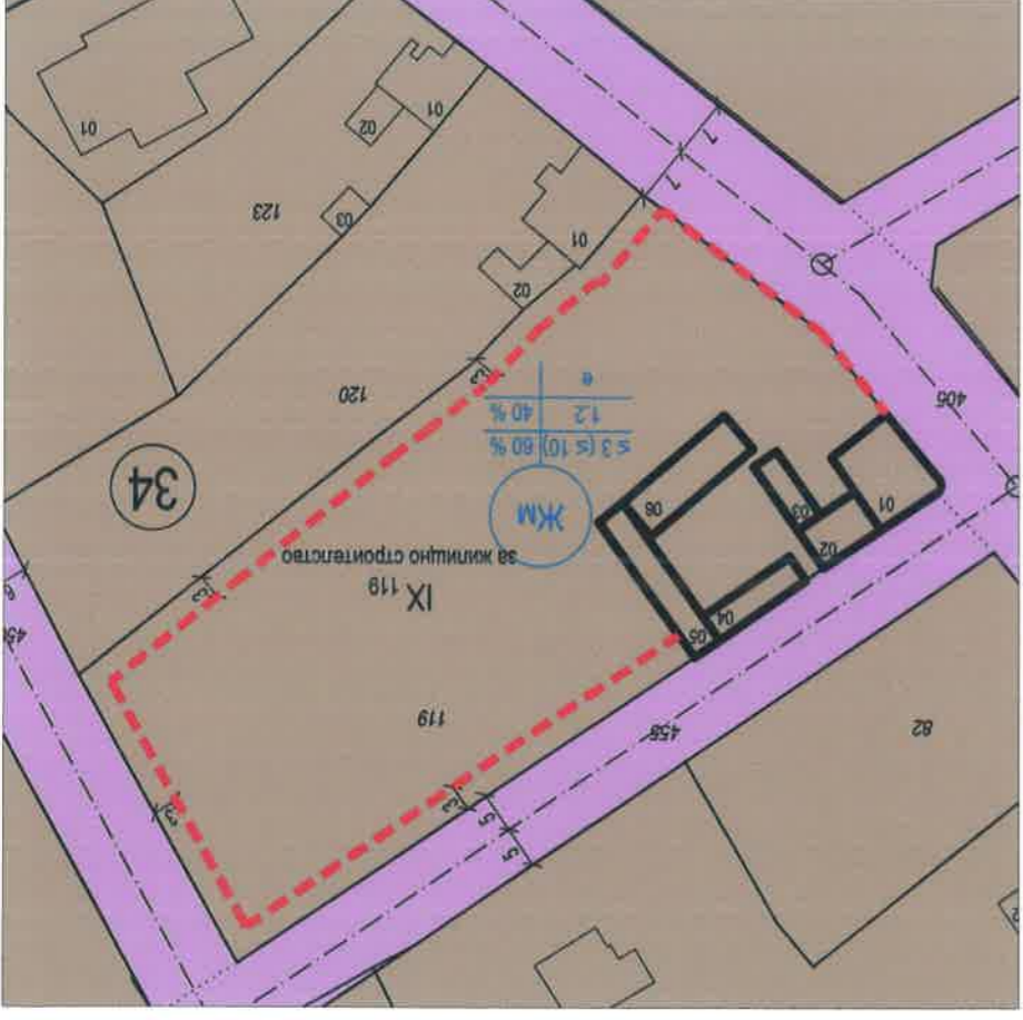
ПЛАН ЗА ЗАСТРОЯВАНЕ